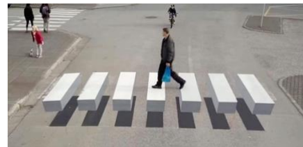
Passage piéton avec effet d'optique.

Les solutions qui pourraient être envisagées sont, par exemple, une attribution de macarons aux plaisanciers et aux riverains comme sur le port d'Arcachon. Cette solution limiterait la surfréquentation des voitures sur la digue Est.