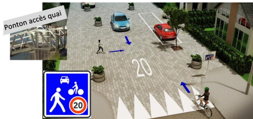
Zone de rencontre Piétons/vélo/voitures – limité à 20Km/h

Avdo propose que des aménagements limitant effectivement la vitesse soient mis en place. Par exemple des « zones de rencontre » à la hauteur de deux à trois pontons d'accès ainsi que des rétrécissements de voie avec îlot .